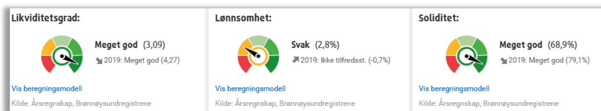
Utklipp 8: Likviditetsgrad, lønnsomhet og soliditet Verdensarvsenter for bergkunst – Alta Museum IKS (2020-2019)

I tillegg til de økonomiske nøkkeltall som ble presentert innledningsvis i siste tabell i kapittel 1.2.2, gir vi i de neste to utklippene andre sentrale økonomiske nøkkeltall 43 for Verdensarvsenter for bergkunst – Alta Museum for henholdsvis perioden 2020-2019 og 2020-2016. I tillegg til likviditetsgrad (likviditetsgrad 1), lønnsomhet (total kapitalrentabilitet i %) og soliditet (egenkapitalandel i %) – som er angitt i utklipp 8 nedenfor – så fremkommer det i utklipp 9 også andre sentrale økonomiske forholdstall. Hva som ligger i de tre begrepene likviditetsgrad, lønnsomhet og soliditet – og hvordan disse beregnes – fremkommer av vedlegg 1 i rapporten.